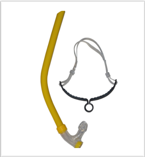
TUBAS à 10 € Stock limité