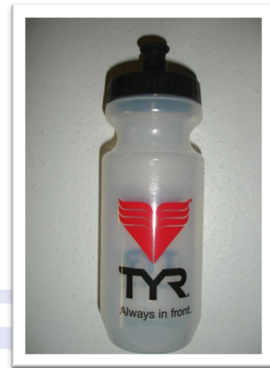
GOURDE à 1 € Série limitée