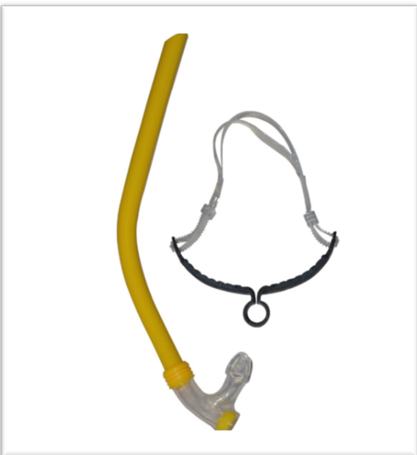
TUBAS à 10 € Stock limité